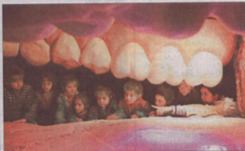
Sobre estas líneas, el grupo en el interior de la boca de la Mujer Gigante. A la izquierda, la expedición junto a un pulmón. A la derecha, el útero, con un bebé de enorme tamaño que conocerá en breve el mundo exterior, ante la sorpresa de los pequeños.