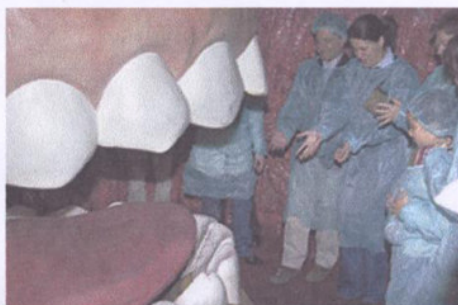
Un grupo visita la 'boca' de la maqueta.

MÓSTOLES.- El misterio del alumbramiento de una nueva vida, pasear por el interior del cuerpo humano y observar desde dentro el funcionamiento de los órganos vitales son algunas de las novedosas experiencias que los visitantes de la exposición 'La mujer gigante' atesorar en Móstoles.