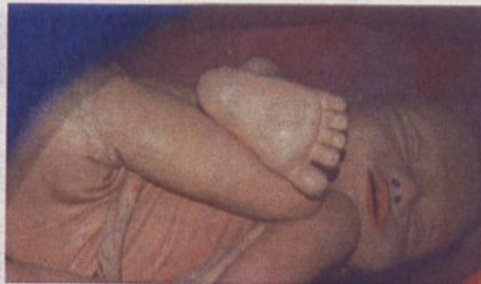
A través de efectos audiovisuales se explica como el niño nace

Desde el pasado 27 de diciembre y hasta el 16 de abril, el Parque Finca Liana acogerá la exposición educativa sobre el cuerpo humano "La Mujer Gigante". La maqueta está construida en una escala de más de veinte veces el tamaño real de una mujer joven, de compleción media y 1,65 metros de estatura real, la cual se encuentra en posición horizontal lo que hace un total de 38 metros de largo y 8 metros de ancho con una altura de 7 metros en su parte más alta. La visita guiada, cuyas indicaciones serán realizadas desde el centro de control, las realiza el Dr. Bueno, médico-jefe del equipo que atiende a "La Mujer Gigante". El recorrido que comienza por la cabeza donde se puede observar la boca, los dientes y la lengua, y a través de unas ventanas, las fosas nasales, los ojos, los oídos y el cerebro. Con esta exposición se enseñará de una forma divertida a niños y mayores como funciona el cuerpo humano así como los procesos que tienen lugar en él.