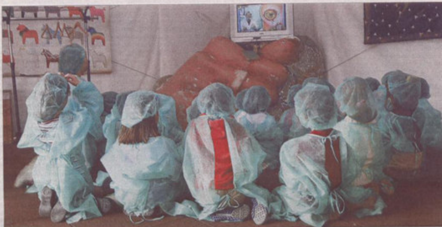
Los niños escuchan las explicaciones iniciales del prestigioso doctor Bueno, que se comunica con ellos a través de videoconferencia.

Un par de metros más adelante, la expedición se adentra en el aparato digestivo. El estómago se balancea suavemente mientras una lluvia fina que simula ser los ácidos cae sobre los hombrecillos verdes, que toman buena nota en sus cabezas de las funciones vitales