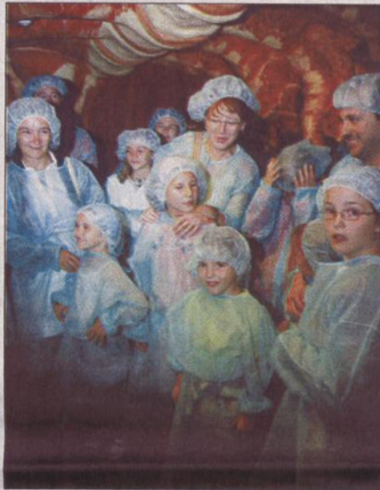
Unos niños se adentran en las profundidades de los pulmones.

Mujer Gigante" nos llevará a través de siete escenarios diferentes, el primero de ellos, una carpa cerrada en la que los expedicionarios deberán ataviarse con batas y gorros de qui-