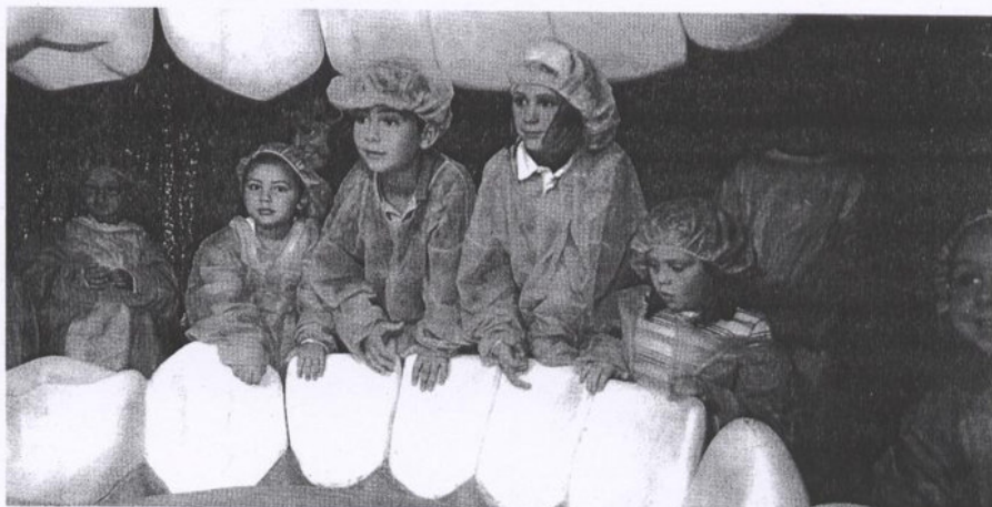
La visita guiada a 'La Mujer Gigante' comienza en la cabeza, donde los visitantes conocen los entresijos que la naturaleza ha preparado para el funcionamiento de los dientes, la lengua, las fosas nasales, los ojos, los oídos y el cerebro. JORDI FREIRE

Al finalizar la intervención, los alumnos pudieron escuchar el resultado de las grabaciones que hicieron durante estos días en el taller de radio que se puso a su disposición y que es una de las novedades de los cursos este año. Las audiciones eran cuentos creados por ellos mismos o leyendas gallegas como la del 'Ponte do demo'. Una vez escuchados todos los relatos se procedió a la entrega de diplomas por la asistencia al curso de 'A radio, un medio puxante no século XXI' durante la última semana. ■