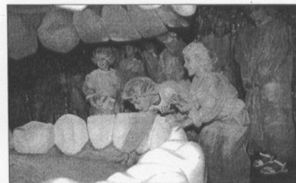
La mujer muestra el interior de su boca

La visita concluye en el embarazo donde puede contemplarse también el nacimiento del bebé.