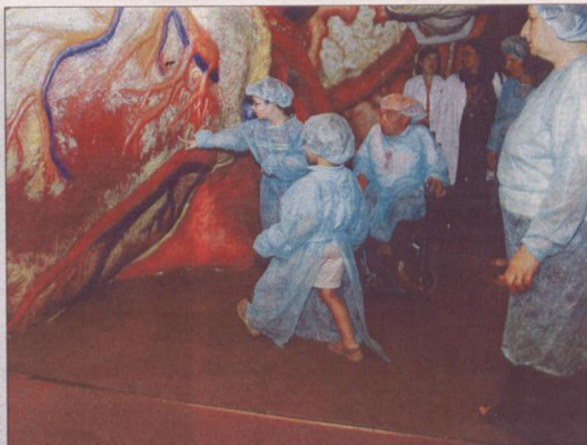
Un niños ven de cerca el funcionamiento del corazón de "La Mujer Gigante".

La atracción didáctica "La Mujer Gigante" muestra en Sanxenxo todos los entresijos de un organismo animado