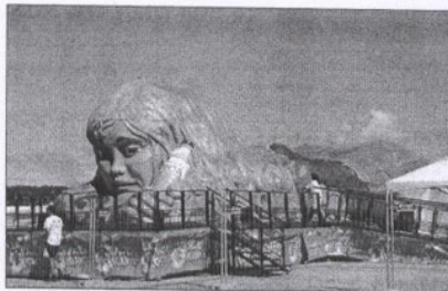
Vista exterior del cuerpo de la mujer.

Tumbada sobre la Plaza del Mar en el puerto de Sanxenxo la "Mujer Gigante" es la atracción de la villa. Con 38 metros de largo, 8 de ancho y 7 de altura esta maqueta permite a niños y mayores conocer a fondo el cuerpo humano. Hasta el día 8 de agosto y en horario de cinco de la tarde a once de la noche, los curiosos podrán realizar visitas