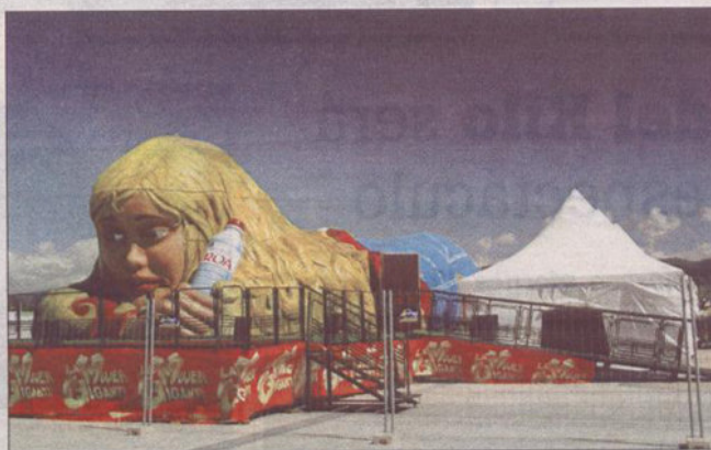
La atracción permanecerá en la Plaza del Mar de Sanxenxo hasta el 8 de septiembre.

ver la epiglottis en movimiento, los pulmones y también el corazón que palpita en la caja torácica. Un poco más abajo, de visita por el estómago, los visitantes se sorprenderán