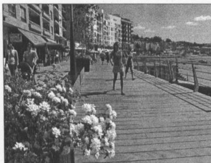
El puerto estrena Paseo peatonal de madera // GUSTAVO SANTOS

que sobresale 8,5 metros de altura desde el paseo marítimo. La construcción circular cuenta con una base de 6 metros de altura y que cuenta en su interior con escaleras de acceso hasta el mirador, compuesto de una pasarela circular de acero inoxidable con barandilla y con muy buenas vistas. La luz de señalización de dos metros y medio cuenta con una potencia de 4 millas de alcance y está coronada por los cuatro puntos cardinales y una veleta con el escudo del concello.