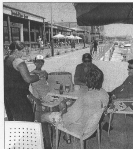
Las Terrazas y locales dan vida al entorno portuario

Esta estructura se situará sobre el aparcamiento e incluso será desmontable en caso de que fuera necesario disponer de la superficie total