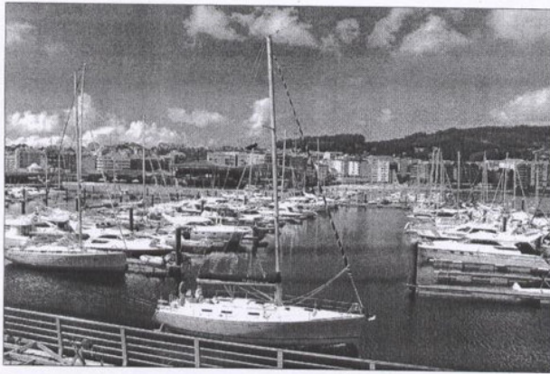
Los nuevos amarres se sitúan en la lámina de agua del puerto deportivo.