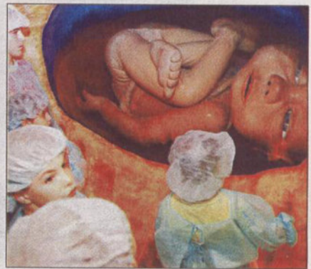
El bebé de "La Mujer Gigante", listo para salir a la luz.

El médico personal de la anfitriona, el doctor Bueno, actuará de guía