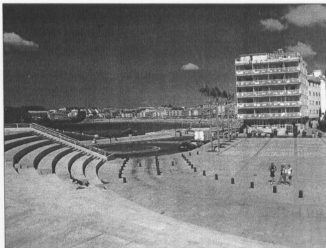
Un aspecto de la nueva Praza dos Barcos

La bautizada como Praza do Mar se ha convertido en el principal espacio público del municipio