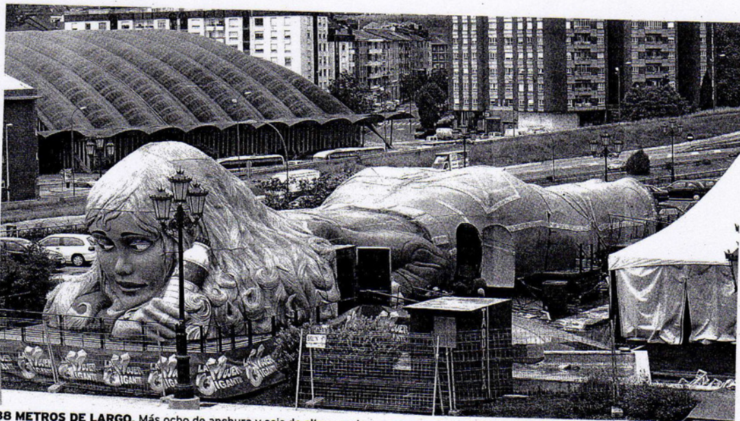
38 METROS DE LARGO. Más ocho de anchura y seis de altura: es lo que ocupa esta mujer sin nombre.

La exposición 'La mujer gigante' permite conocer el funcionamiento del organismo y 'jugar' a cirujanos en la explanada de Los Prados