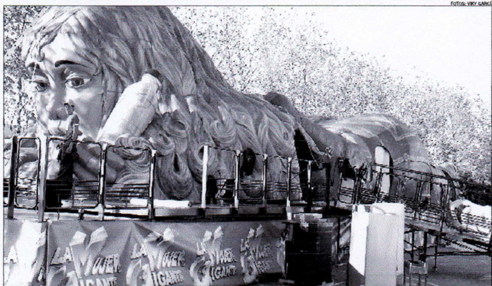
Los operarios apuraban ayer los trabajos en el parque de Xixón para acabar de montar todo el entramado de la 'mujer gigante'